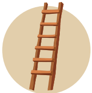
שיטת הסולם פותרים בעיות שלב אחר שלב