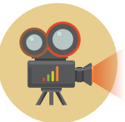
שיטת המסרטה פותרים בעיות מהסוף להתחלה