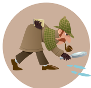
שיטת הבלש שואלים שאלות ופותרים בעיות