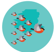
שיטת הציפורים הנוודות פועלים בשיתוף פעולה