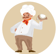
שיטת השף הופכים רעיון למציאות