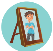
שיטת המראות מתבוננים ולומדים מחוויות אישיות