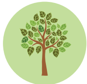
שיטת עץ החשיבה בוחנים אפשרויות ומקבלים החלטות