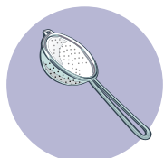
שיטת המסוננת מפרידים בין עיקר לטפל