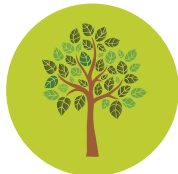
שיטת עץ החשיבה