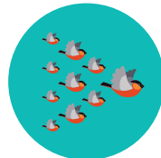
שיטת הציפורים הנוודות